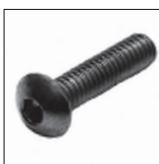
ISO 7380 Linsenschraube mit Iseka