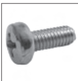
DIN 7985 Linsenschraube mit Kreuzschlitz