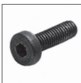
DIN 7984 Zylinderkopfschraube Inbus