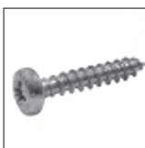
Spanplattenschraube Rundkopf (Pan Head)