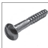
DIN 96 Holzschraube