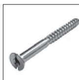
DIN 97 Holzschraube mit M3 Kopfgewinde verzinkt