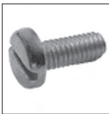
DIN 85 Flachkopfschraube