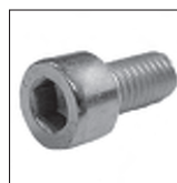
DIN 912 Zylinderkopfschraube Inbus