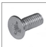
DIN 965 Senkschraube