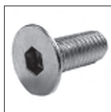
DIN 7991 Senkschraube Iseka