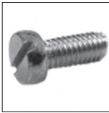
DIN 84 Zylinderschraube