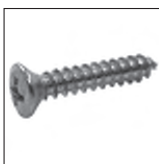
DIN 7983 Form C Linsensenkkopf Kreuz Blechschraube