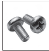
DIN 7985 Linsenkopfschraube mit Unterkopferzahnung