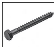
DIN 571 6kt. Holzschraube