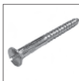
DIN 95 Holzschraube