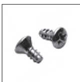
DIN 7983 Form F ohne Spitze Linsensenkkopf Kreuz Blechschraube