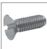
DIN 963 Senkschraube