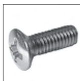
DIN 966 Linsensenkschraube