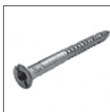
DIN 97 Holzschraube mit Ø 3 Kopfbohrung