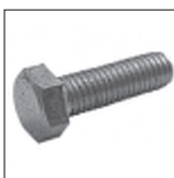
DIN 933 6kt. Schraube