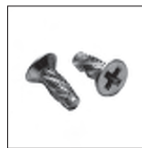
DIN 7516 DE Senkkopfschraube Kopf ähnl. DIN 965