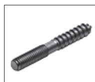
FE Stockschraube gewalztes Gewinde