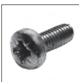
DIN 7500 - Form C Gewindefurchschraube ähnlich 7985