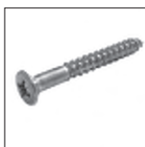
DIN 7996 Holzschraube Kreuzschlitz