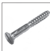
DIN 97 Holzschraube