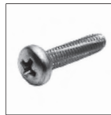
DIN 7516 AE Linsenschraube Kopf ähnl. DIN 7985