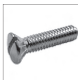
DIN 964 Linsensenkschraube