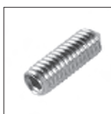
DIN 914 Made Iseka mit Spitze