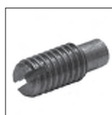
FE Made mit Zapfen