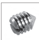
DIN 553 Made mit Spitze