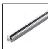
DIN 975 Gewindestange