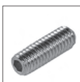
DIN 913 Made Iseka ohne Spitze