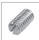
DIN 551 Made ohne Spitze