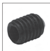
DIN 916 Made Iseka mit Ringschneide