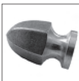
Messing Zierknopf (Guss)