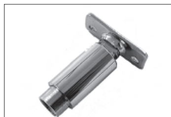
Messing - Dreh - Kippgelenk