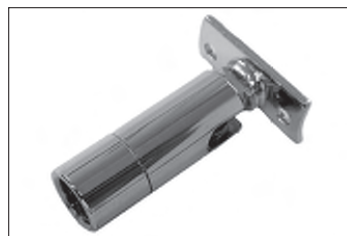
Messing - Dreh - Kippgelenk