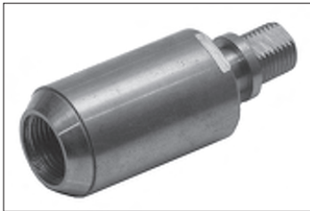
Messing - Kugelgelenk