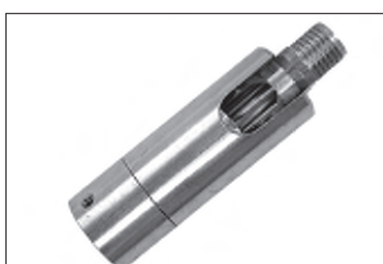
Messing - Dreh - Kippgelenk