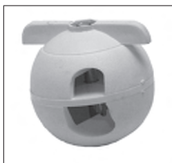
Kunststoff - Kugeldrehgelenk