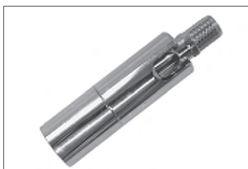
Messing - Dreh - Kippgelenk