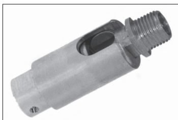
Messing - Dreh - Kippgelenk