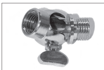
Messing - Flügelgelenk