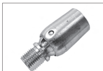
Messing - Kugelgelenk