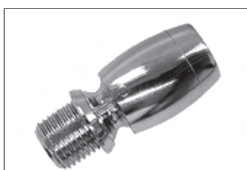
Messing - Kugelgelenk