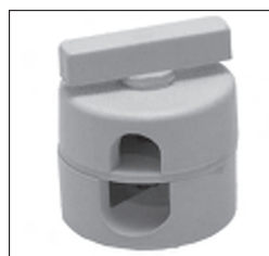
Kunststoff - Scheibengelenk