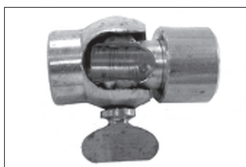
Messing - Flügelgelenk