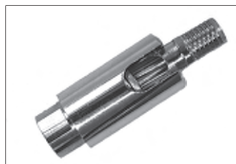
Messing - Dreh - Kippgelenk