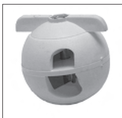
Kunststoff - Kugeldrehgelenk