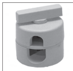
Kunststoff - Scheibengelenk