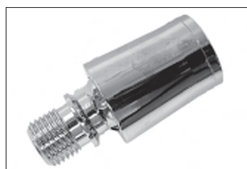
Messing - Kugelgelenk