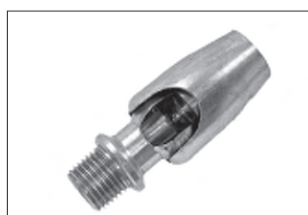
Messing - Kugel - Kippgelenk