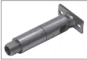
Messing - Dreh - Kippgelenk