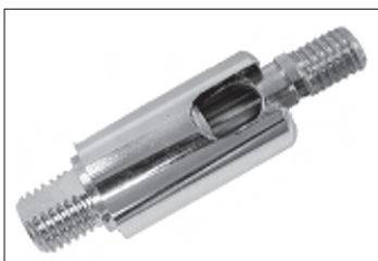
Messing - Dreh - Kippgelenk