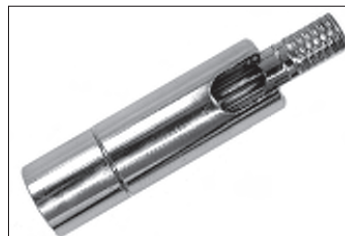
Messing - Dreh - Kippgelenk