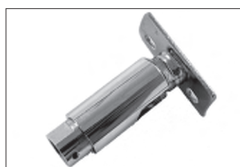
Messing - Dreh - Kippgelenk