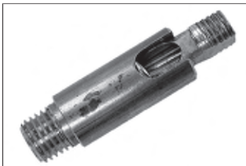
Messing - Dreh - Kippgelenk