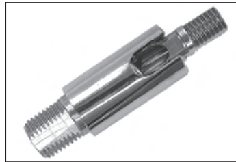
Messing - Dreh - Kippgelenk