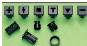
LED Verbindungen + Supports