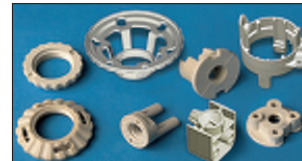
Fassungen für Halogen