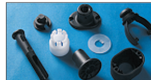
Verbindung für Spots Leuchtensockel