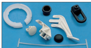
Lampenschirmhalterungen Adapterring Reduzierbefestigungen