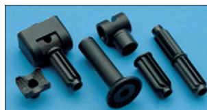
Gelenke für Reflektoren