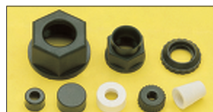
Iso- und Überwurfmuttern