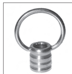
Ms Ringnippel beweglicher Bügel rund