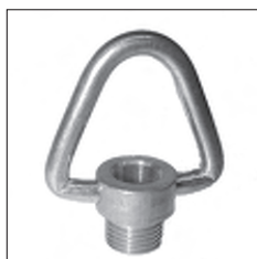
Ms Ringnippel beweglicher Bügel dreieckig