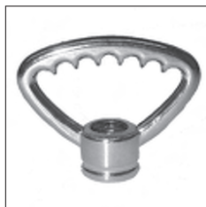
Zahnringnippel Druckguss Durchgangsgewinde dreieckig