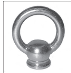
Ringnippel Druckguss Sackgewinde