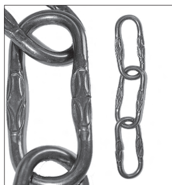
FE Kette geprägt