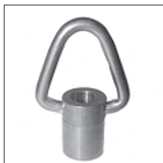
Ms Ringnippel beweglicher Bügel dreieckig