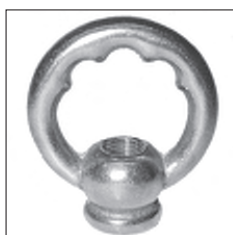
Ms Zahnringnippel rund Durchgangsgewinde