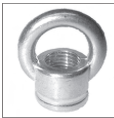
Ringnippel Druckguss Durchgangsgewinde