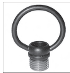
Ms Ringnippel beweglicher Bügel rund