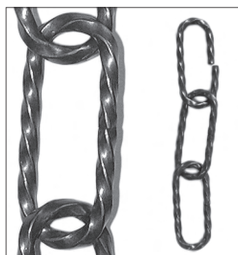
FE Kette gedreht